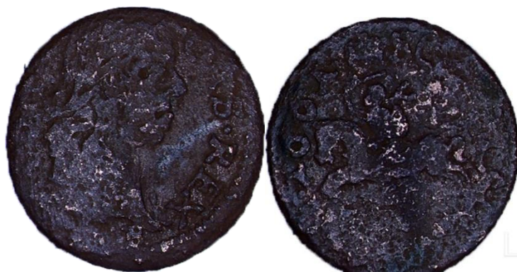
Рисунок 1 – Литовский солид 1661 г.

7) бракованный солид: лиц. ст. – надпись по кругу «NAOI»; об. ст. – «IOAN» (рисунок 4).