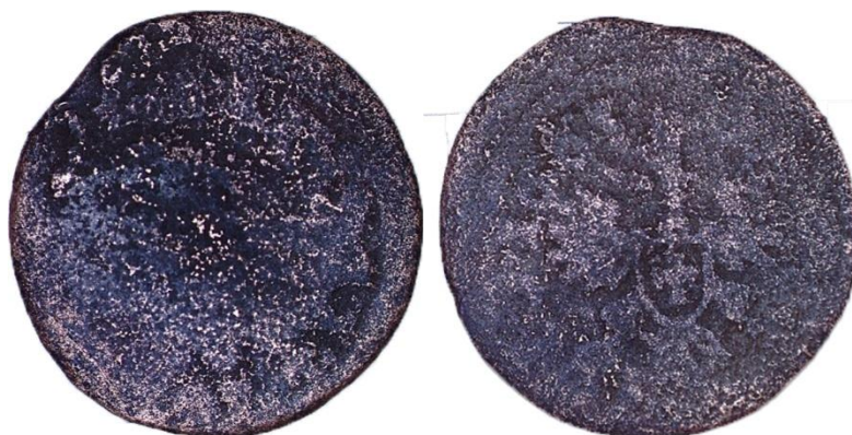
Рисунок 2 – Польский солид 1663 г.