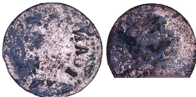
Рисунок 4 – Бракованный солид

Установить, какой именно монетный двор их отчеканил, не представляется возможным. Однако немаловажны исторический контекст их появления и связь с денежной реформой, после которой данный тип монет начал распространяться [1, с. 87–110].