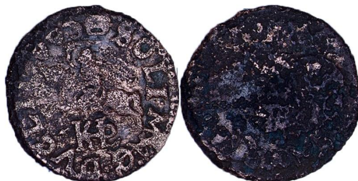
Рисунок 3 – Литовский солид 1665 г.