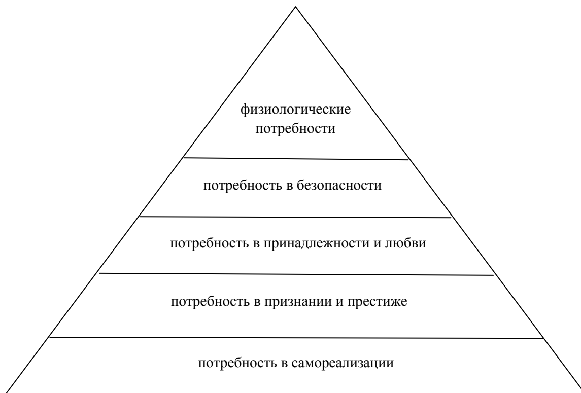
Рисунок 1 – Пирамида потребностей А. Маслоу

хода к исследованию проблем самореализации. Умышленно подчеркиваем слово «научной», потому что опыт показывает, что не всегда это находит отражение в реальности. Как видно на рис. 1 А. Маслоу выделил пять групп психических потребностей человека.