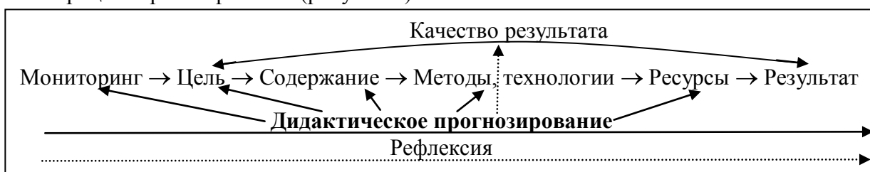
Рисунок 2 – Системное дидактическое прогнозирование

Исходя из вышесказанного, конкретизируем сущность понятия «дидактическое прогнозирование». Как один из векторов образовательного прогнозирования, дидактическое прогнозирование является объектом дидактической прогностики – научной дисциплины в контексте образовательной прогностики, изучающей закономерности, принципы, методы и технологии дидактического прогнозирования. Дидактическое прогнозирование целесообразно рассматривать и как метод научного исследования, направленного на получение объективных междисциплинарных данных и последующее моделирование на их основе возможных сценариев развития дидактической системы. С нашей точки зрения, в контексте системы менеджмента качества вуза особое значение приобретает дидактическое прогнозирование как инвариантный компонент дидактического проектирования и наукоемкий инструмент (технология) управления качеством дидактической системы . Дидактическое прогнозирование пронизывает весь процесс проектирования (рисунок 2).